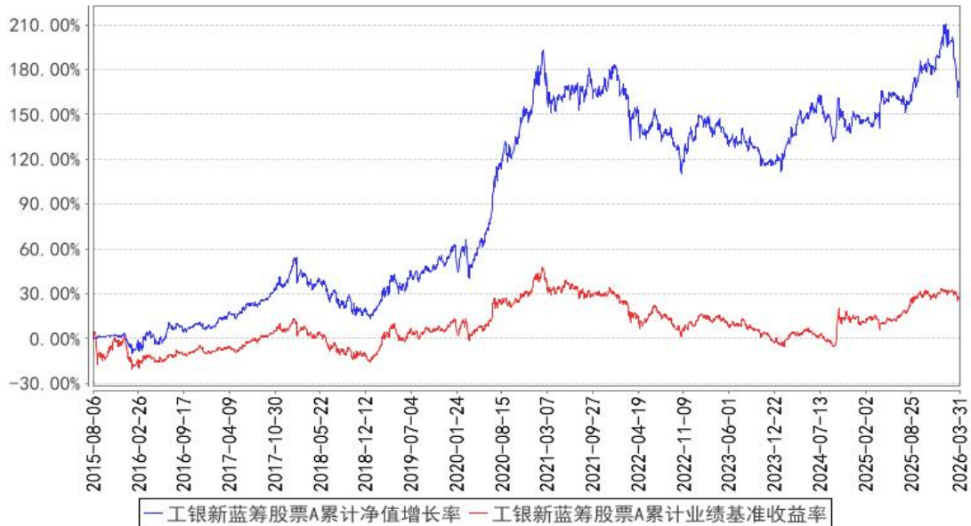
工银新蓝筹股票A累计净值增长率与同期业绩比较基准收益率的历史走势对比图