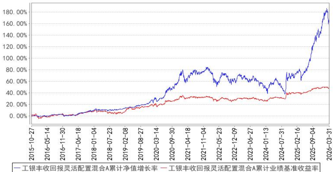
工银丰收回报灵活配置混合A累计净值增长率与同期业绩比较基准收益率的历史走势对比图