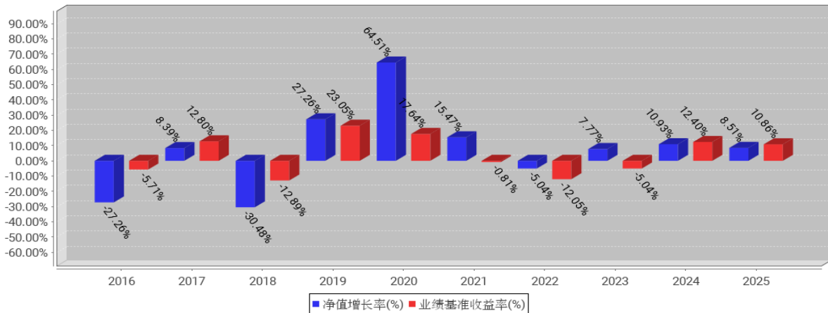
工银精选平衡混合基金每年净值增长率与同期业绩比较基准收益率的对比图(2025年12月31日)

注：1、本基金基金合同于2006年7月13日生效。合同生效当年不满完整自然年度的，按实际期限计算净值增长率。