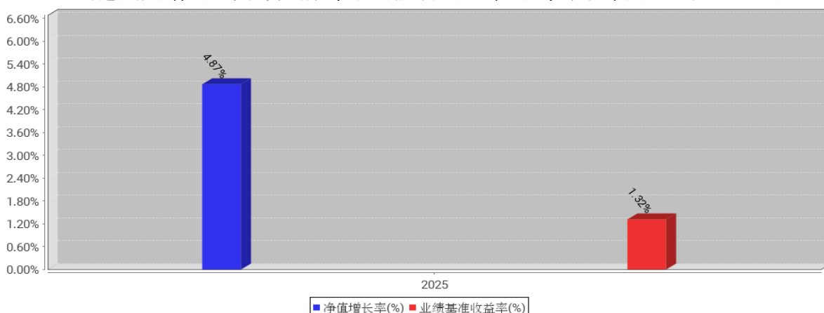
工银臻选回报混合基金每年净值增长率与同期业绩比较基准收益率的对比图（2025年12月31日）

注：1、本基金基金合同于 2025 年 9 月 2 日生效。合同生效当年不满完整自然年度的，按实际期限计算净值增长率。