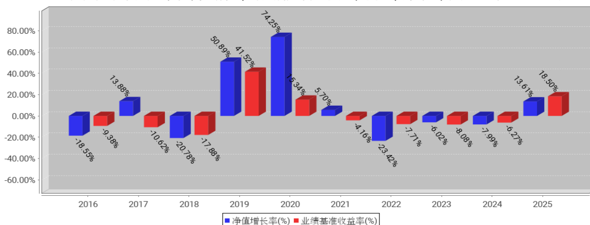
工银农业产业股票基金每年净值增长率与同期业绩比较基准收益率的对比图（2025年12月31日）

注：1、本基金基金合同于2015年5月26日生效。合同生效当年不满完整自然年度的，按实际期限计算净值增长率。