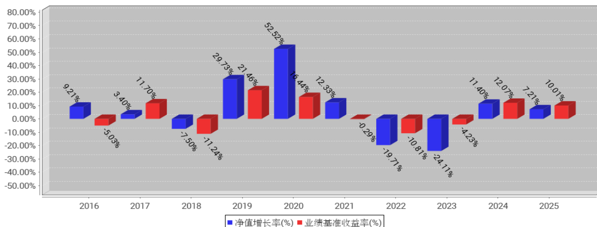
工银新财富灵活配置混合基金每年净值增长率与同期业绩比较基准收益率的对比图（2025年12月31日）

注：1、本基金基金合同于 2014 年 09 月 19 日生效。合同生效当年不满完整自然年度的，按实际期限计算净值增长率。