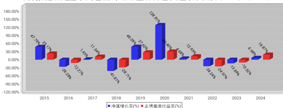
工银高端制造股票基金每年净值增长率与同期业绩比较基准收益率的对比图（2024年12月31日）

注：1、本基金基金合同于2014年10月22日生效。合同生效当年不满完整自然年度的，按实际期限计算净值增长率。