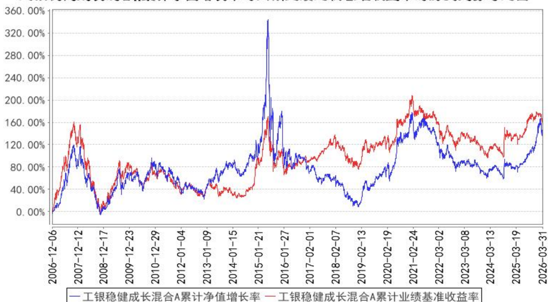
工银稳健成长混合A累计净值增长率与同期业绩比较基准收益率的历史走势对比图